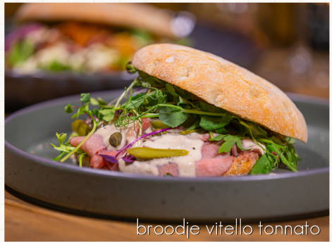
broodje vitello tonnato