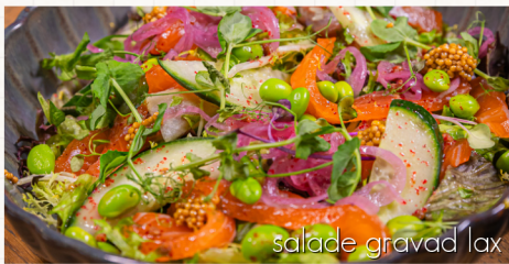
salade gravad lax

gemengde sla, huisdressing, tartaar van rode biet en zoetzure paarse wortel, dressing van merlotazijn, bietengel, honing-tijm crumble en geitenkaasmousse