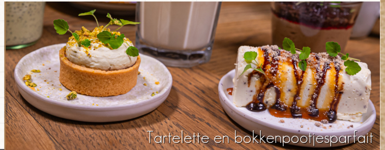
Tartelette en bokkenpootjesparfait