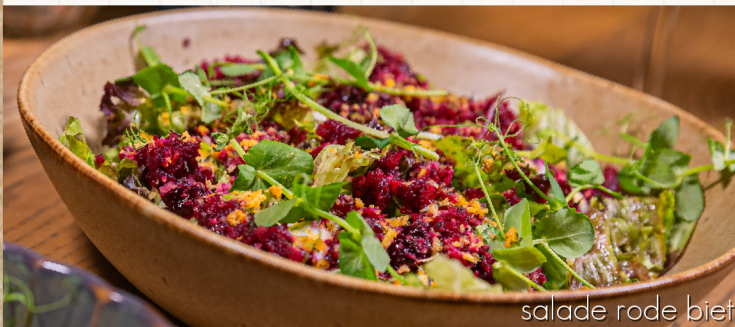
salade rode biet

gemengde sla, huisdressing, tartaar van rode biet en zoetzure paarse wortel, dressing van merlotazijn, bietengel, honing-tijm crumble en geitenkaasmousse