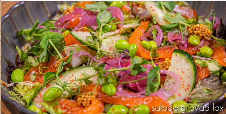
salade gravad lax

gemengde sla, huisdressing, rundercarpaccio, truffelmayo, Parmezaanse kaas, tomaatjes, rucola en crumble van zwarte olijven en baked beans